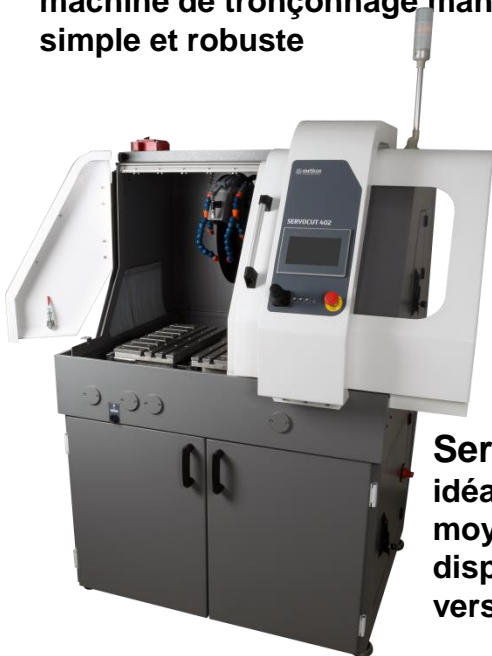
Servocut 402/502 idéal pour des pièces moyennes et grands, disponible en différentes versions

très grand espace de tronçonnage et excellente accessibilité. disponible en différentes versions