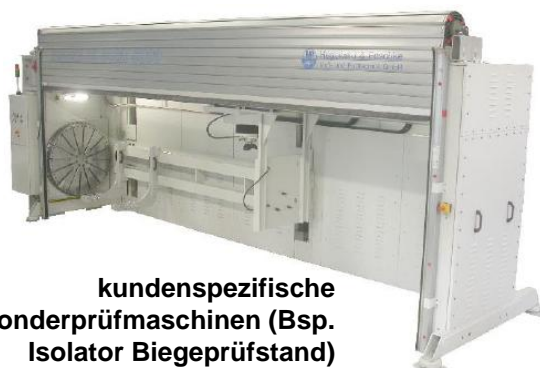
kundenspezifische Sonderprüfmaschinen (Bsp. Isolator Biegeprüfstand)